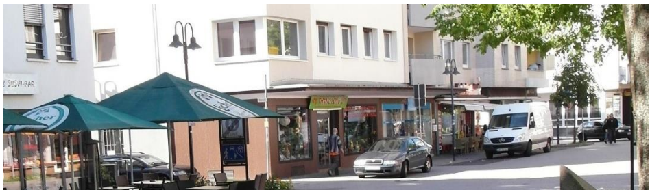
Walltorstraße 1, Eingang Wetzsteinstraße

Bankverbindung: Sparkasse Gießen, IBAN DE17513500250200516671